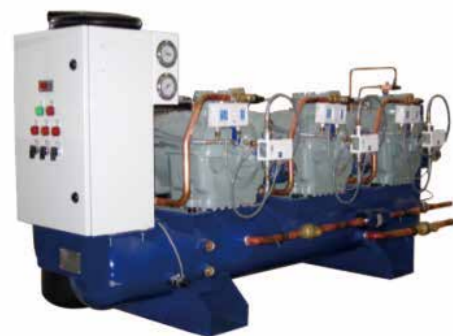
E 系列活塞并联机组 (13~45HP)