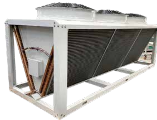
900mmV 型冷凝器 风机数量：2~3 个 换热量：97~259.7kW