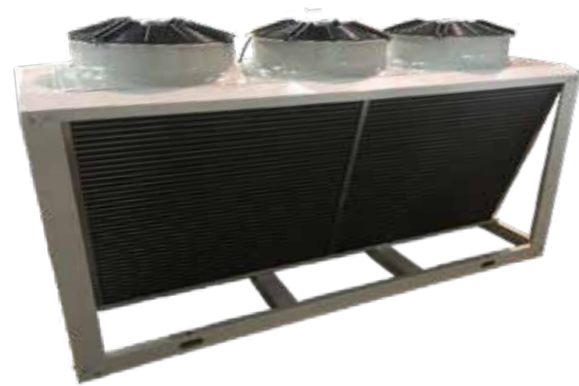
630mmV 型冷凝器 风扇数量：1~3 换热量：28.2~110.9 kW